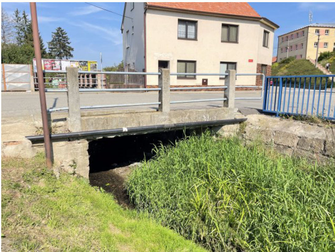
Obr. 22: Most ulice Rolínkova (nekapacitní) - jižní strana (Lysický potok, ř. km 0.3)