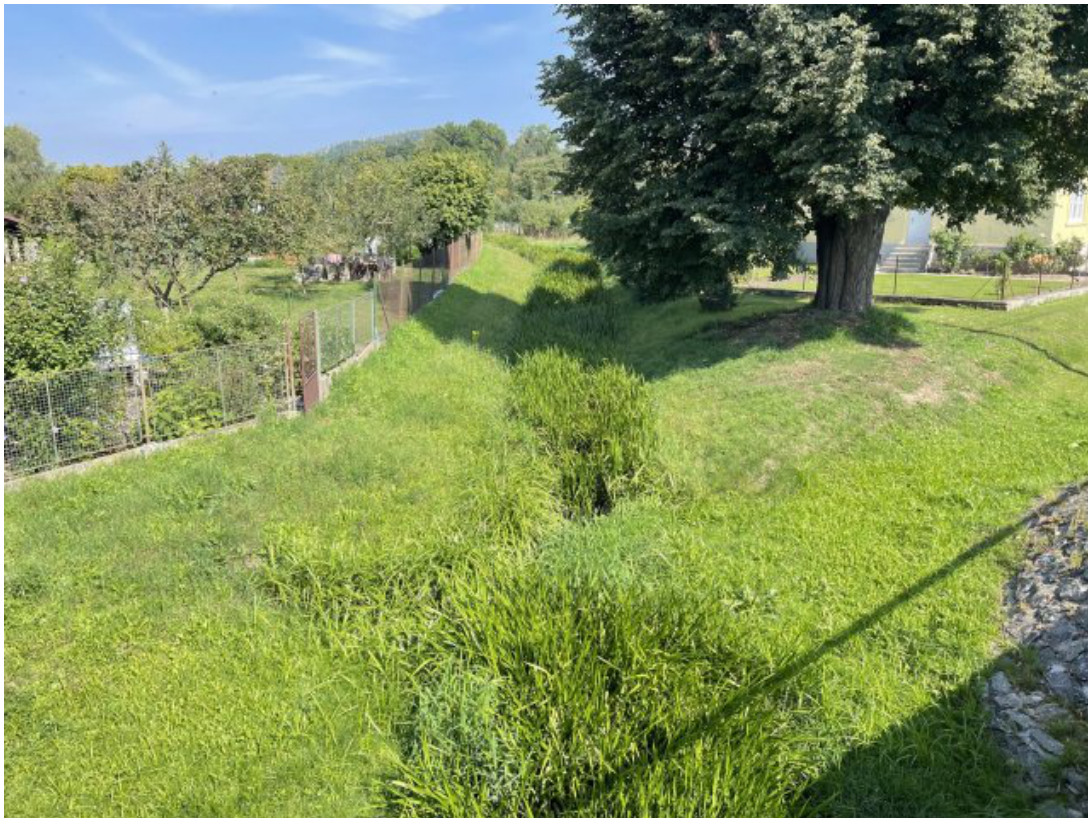
Obr. 17: Lysický potok - charakter toku z mostu ulice Chlumská (proti proudu, ř. km 0.65)