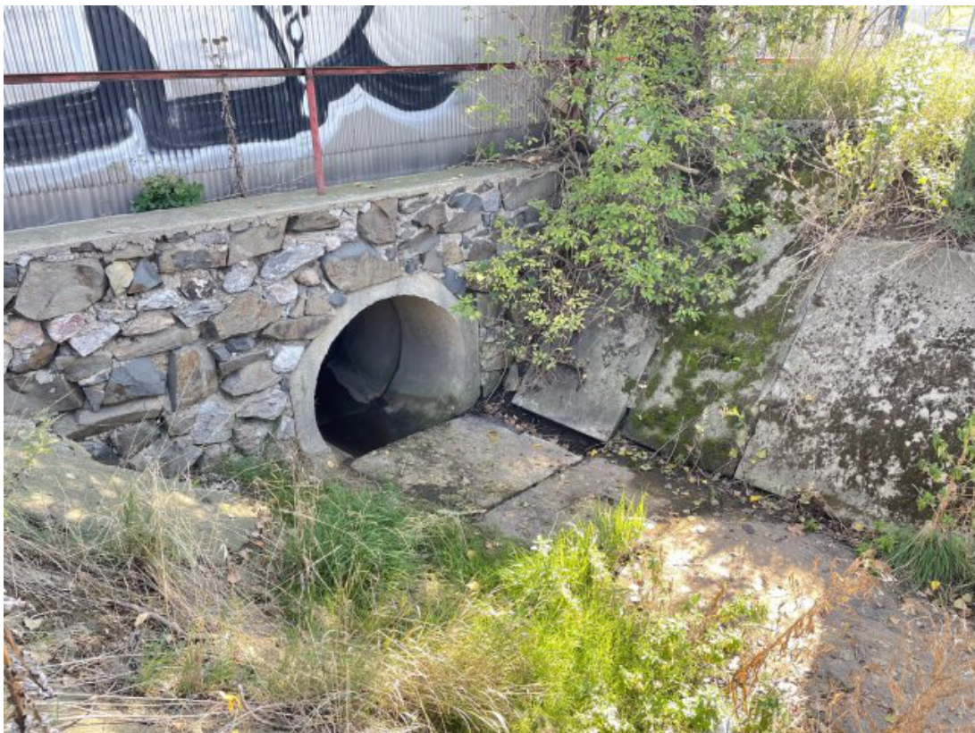
Obr. 24: Zatrubnění Žerůtského potoka - kritické místo (ř. km 0.35)