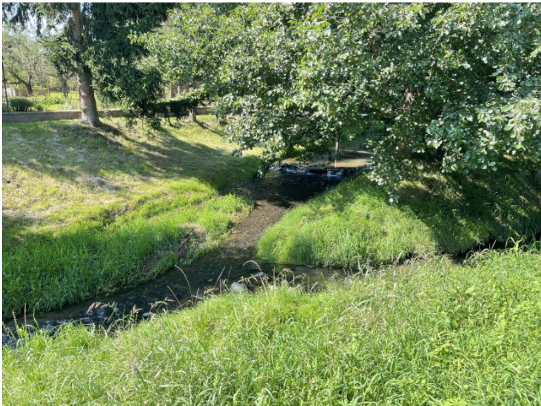
Obr. 11: Soutok Lysického potoka s Býkovou (proti proudu, ř. km 3.7)