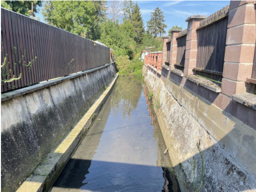
Obr. 21: Lysický potok - charakter toku z mostu ulice Rolínkova (proti proudu, ř. km 0.3)