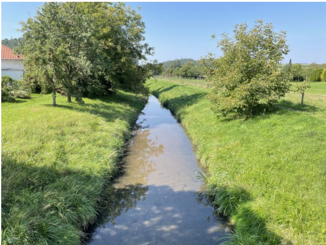
Obr. 6: Býkovka - charakter toku z mostu ulice Sokolská (proti proudu, ř. km 3.8)