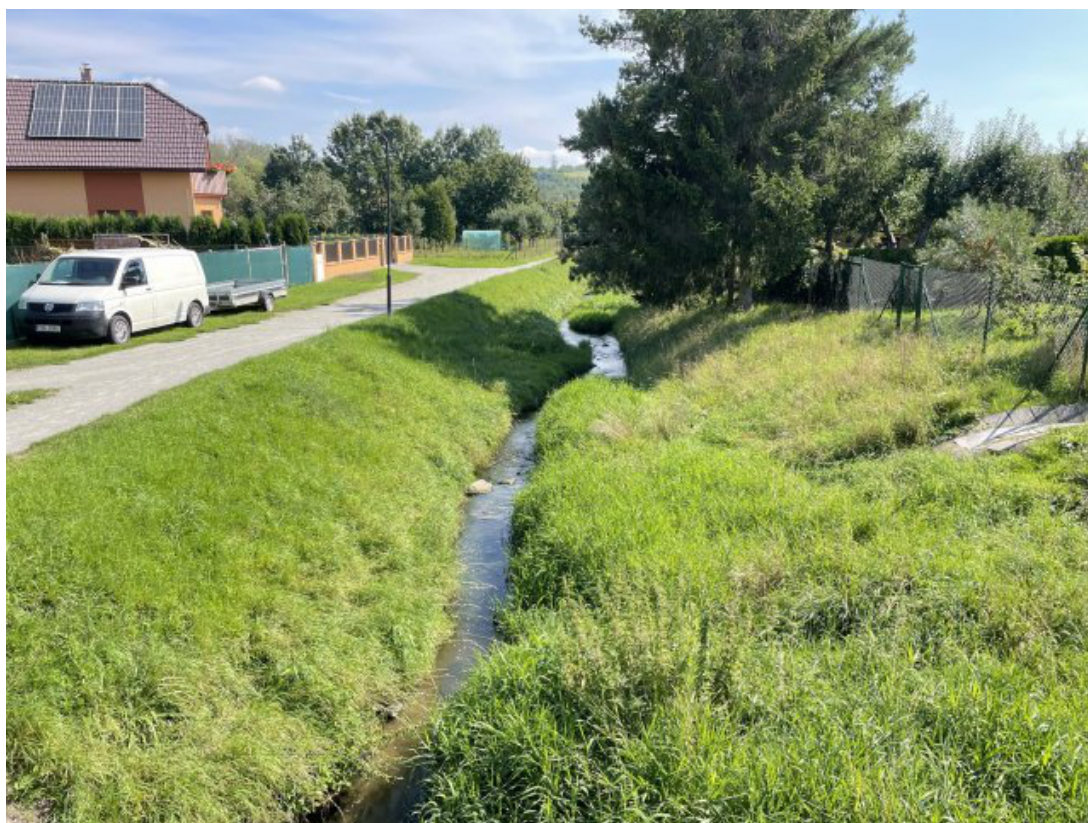
Obr. 9: Býkovka - charakter toku z mostu ulice Sokolská (po proudu, ř. km 3.8) - nekapacitní koryto