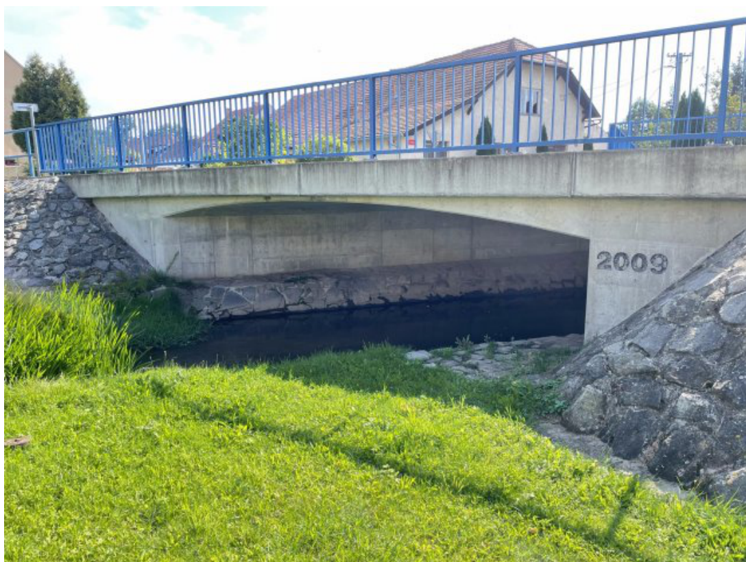
Obr. 18: Most ulice Chlumská (kapacitní, místo hlásného profilu) - severní strana (Lysický potok, ř. km 0.65)