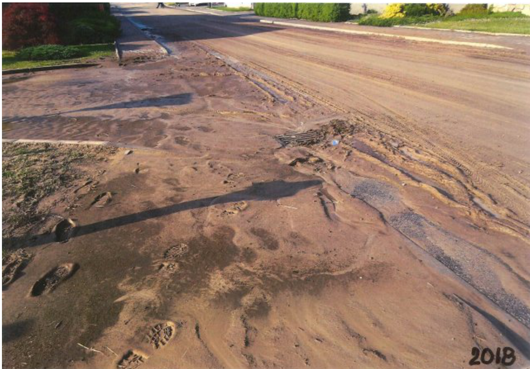
Obr. 43: Povodeň 5. června 2018 - ulice Polní