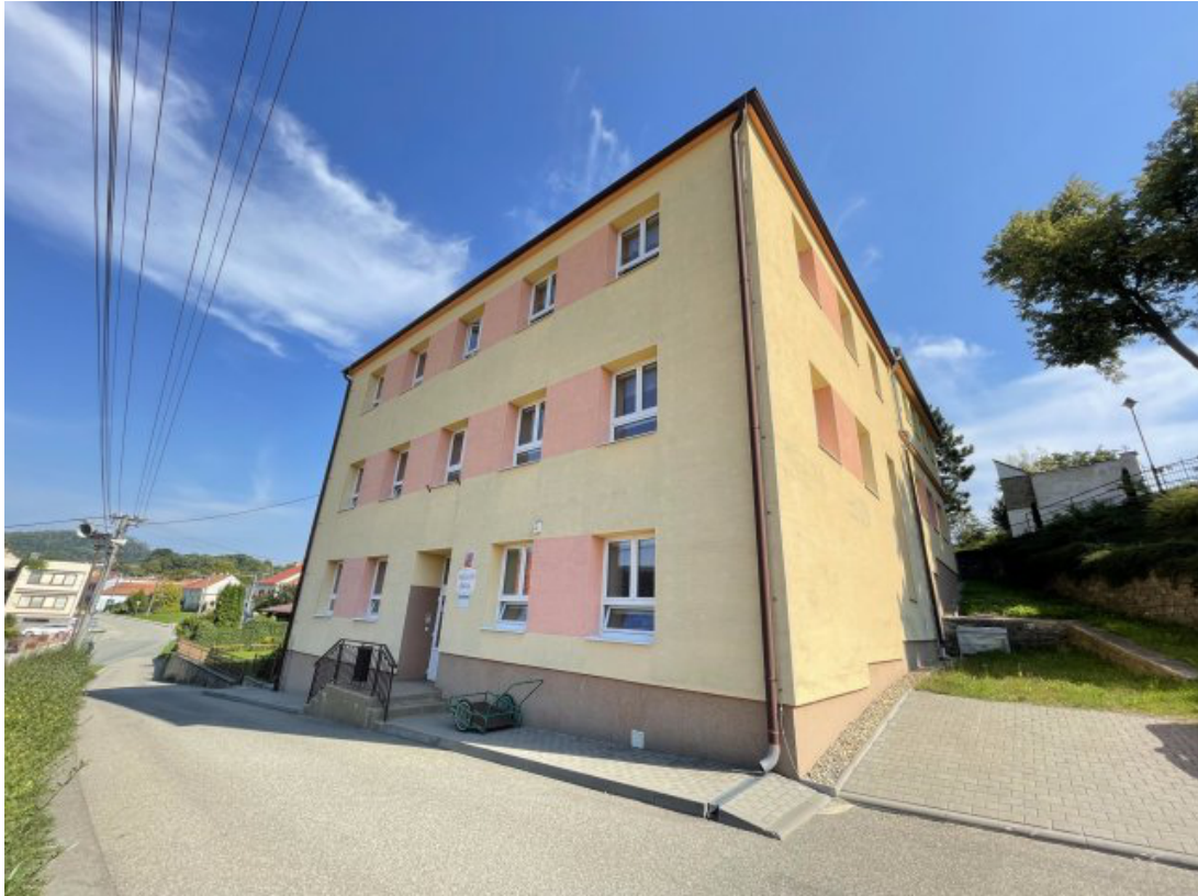
Obr. 5: Základní škola Bořitov - evakuační místo