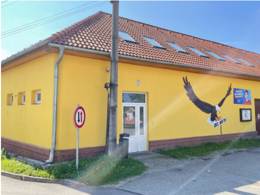
Obr. 3: Orlovna Bořitov - evakuační místo