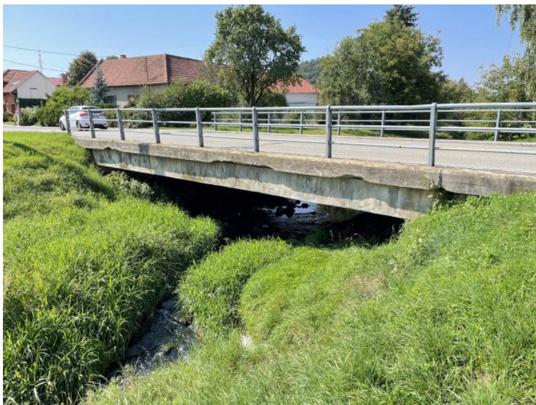
Obr. 8: Most ulice Sokolská (kapacitní, místo hlásného profilu) - východní strana (Býkovka, ř. km 3.8)