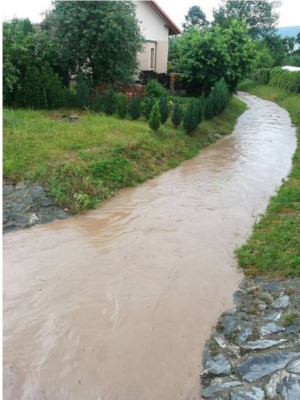
Obr. 40: Povodeň 5. června 2018 - Lysický potok z mostu ulice Chlumská