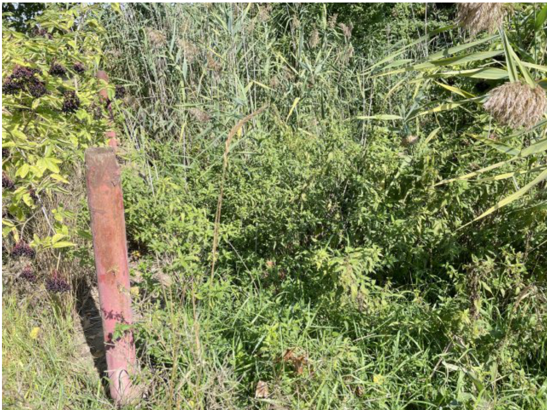
Obr. 26: Žerůtský potok - charakter toku po opuštění zatrubnění (po proudu, ř. km 0.2)