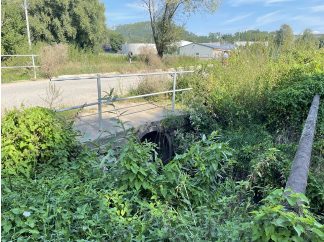
Obr. 14: Propustek přes Lysický potok - jižní strana (Lysický potok, ř. km 1.45)