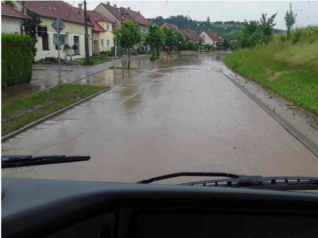
Obr. 38: Povodeň 5. června 2018 - ulice Trávníky