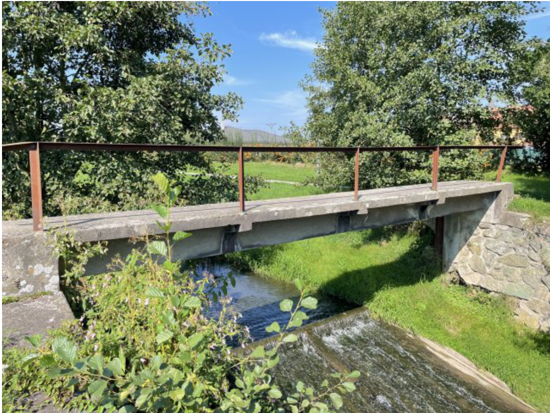
Obr. 12: Lávka nad betonovým skluzem (Býkovka, ř. km 3.6) - kritické místo