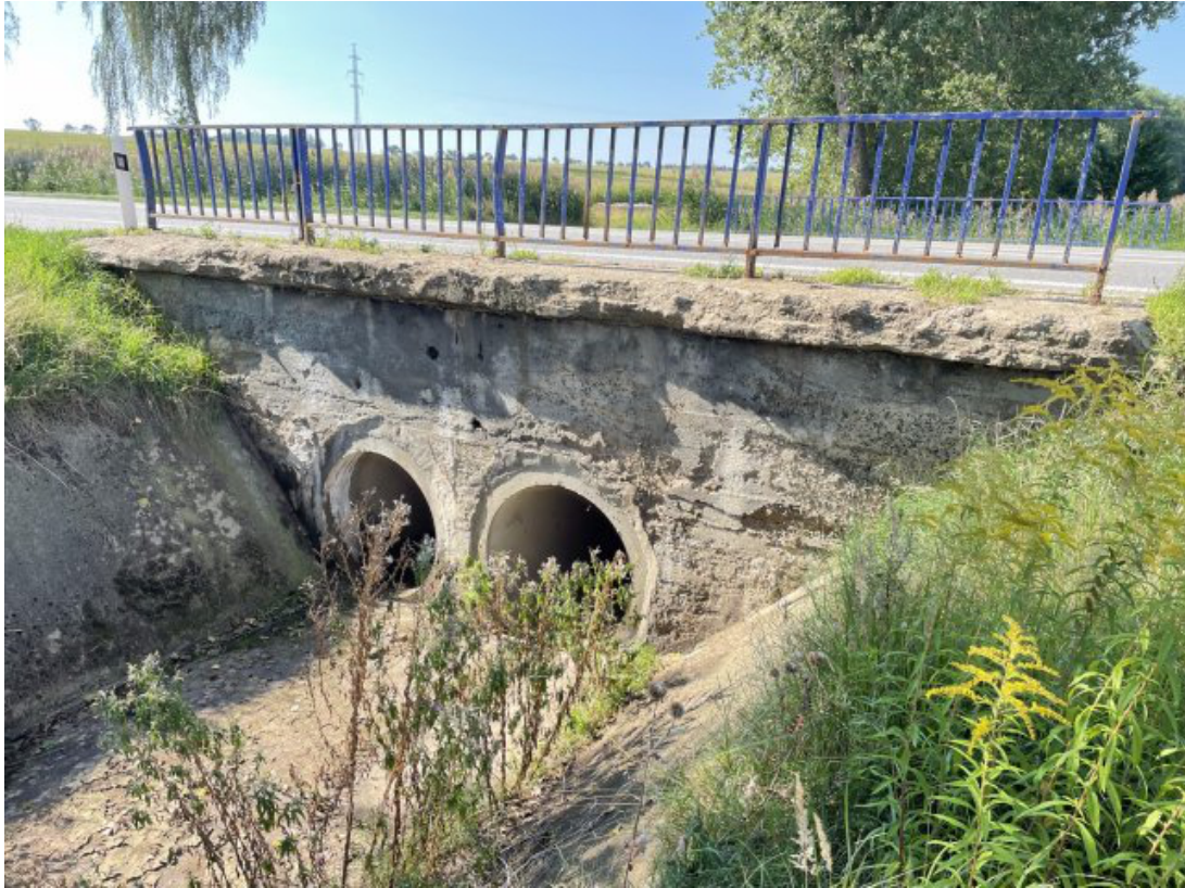
Obr. 25: Propustek pod silnicí R43 před zatrubněním Žerůtského potoka (ř. km 0.35)