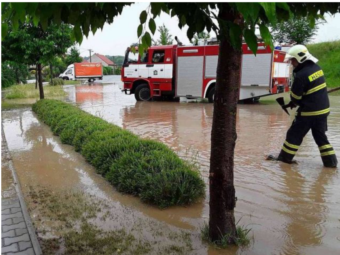
Obr. 37: Povodeň 5. června 2018 - ulice Trávníky