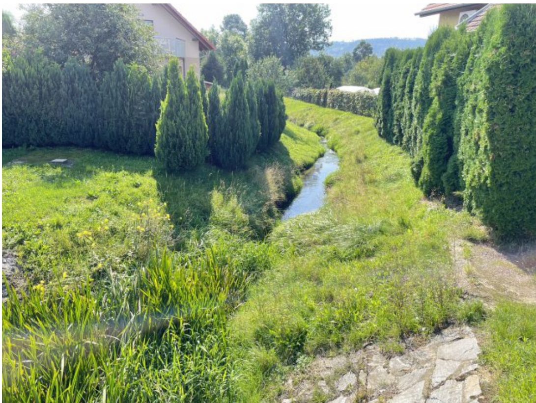
Obr. 20: Lysický potok - charakter toku z mostu ulice Chlumská (po proudu, ř. km 0.65)