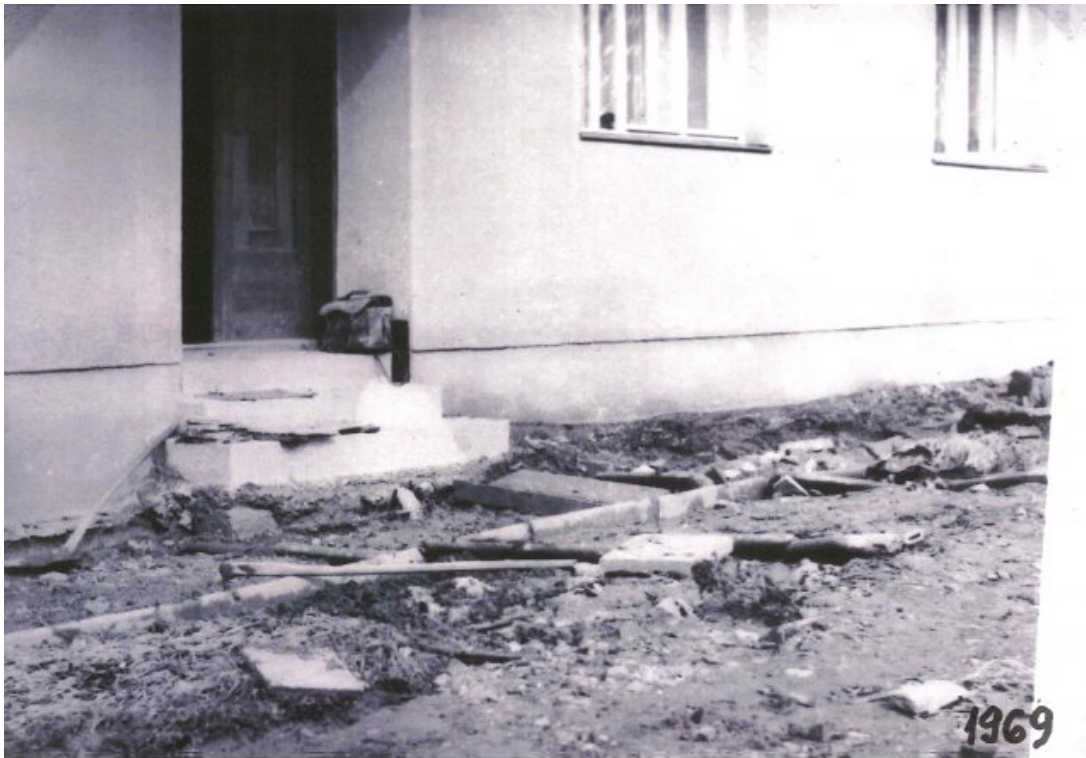
Obr. 31: Povodeň 6. července 1969 - před Místním národním výborem