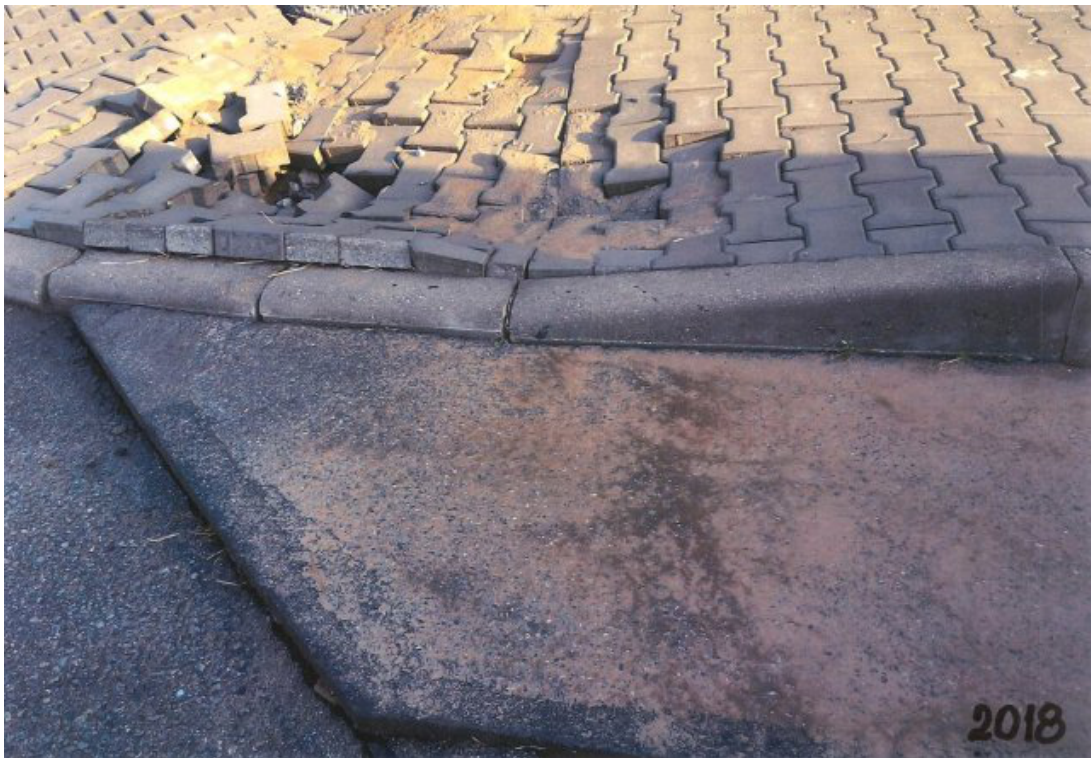
Obr. 44: Povodeň 5. června 2018 - ulice Polní