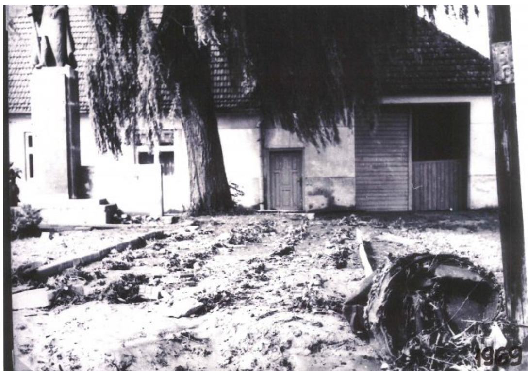
Obr. 33: Povodeň 6. července 1969