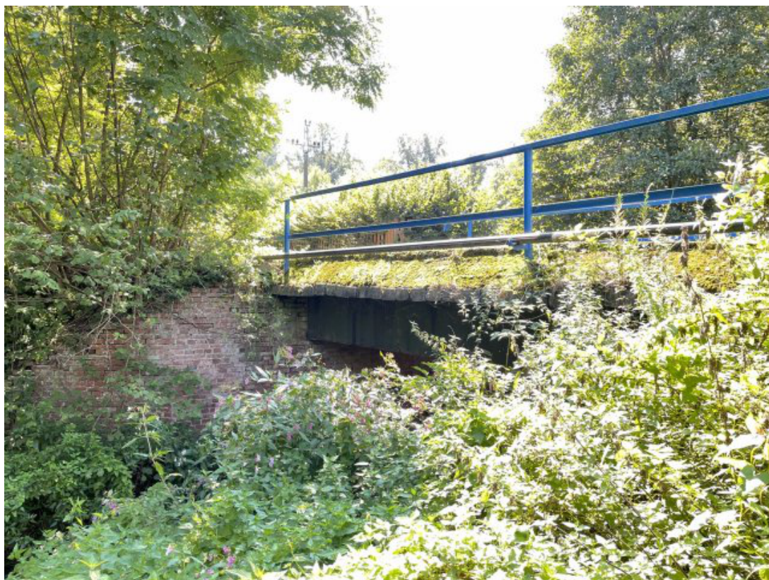
Obr. 29: Most ulice U Lihovaru (Černá Hora) - místo hlásného profilu (Býkovka, ř. km 4.75)