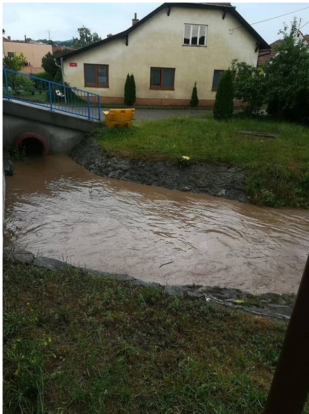
Obr. 41: Povodeň 5. června 2018 - Lysický potok z mostu ulice Chlumská