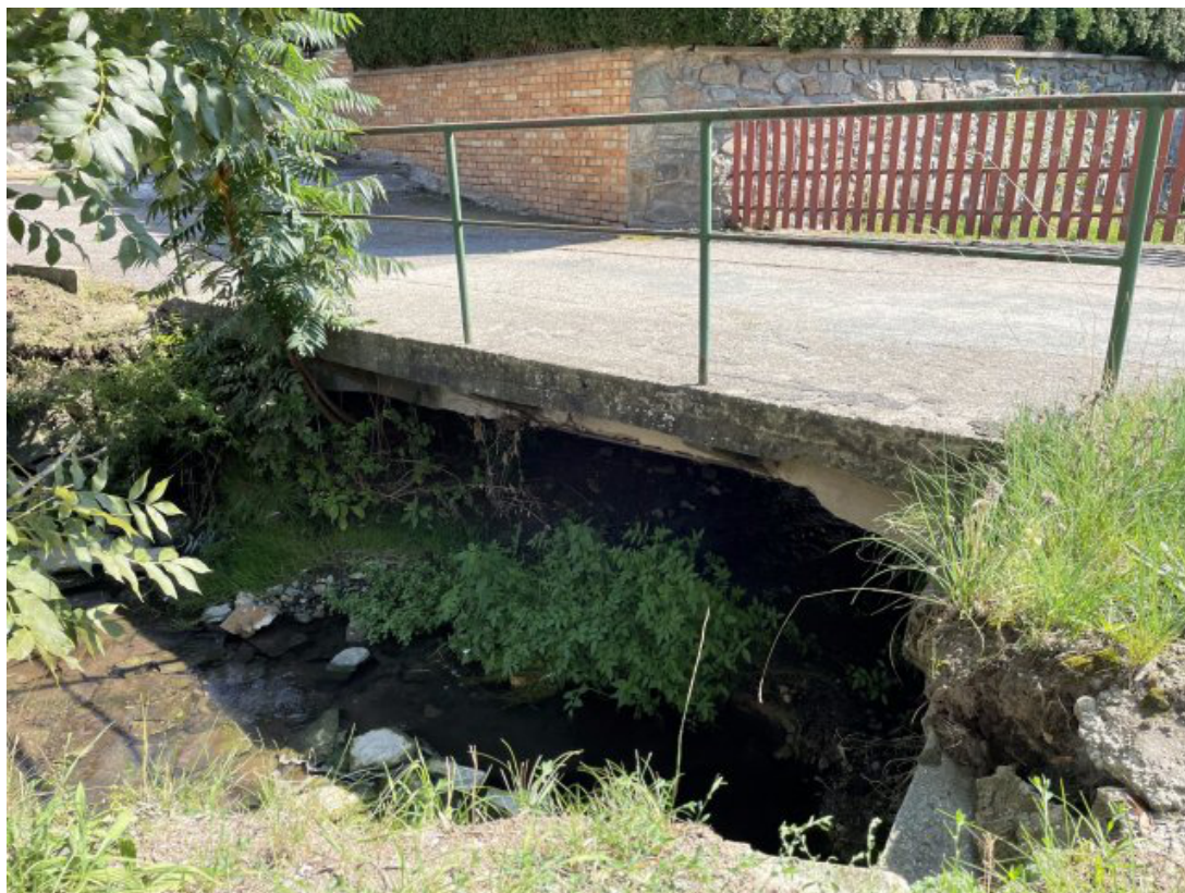
Obr. 30: Most ulice Potoční (Černá Hora) - místo hlásného profilu (Žerotínka, ř. km 0.73)