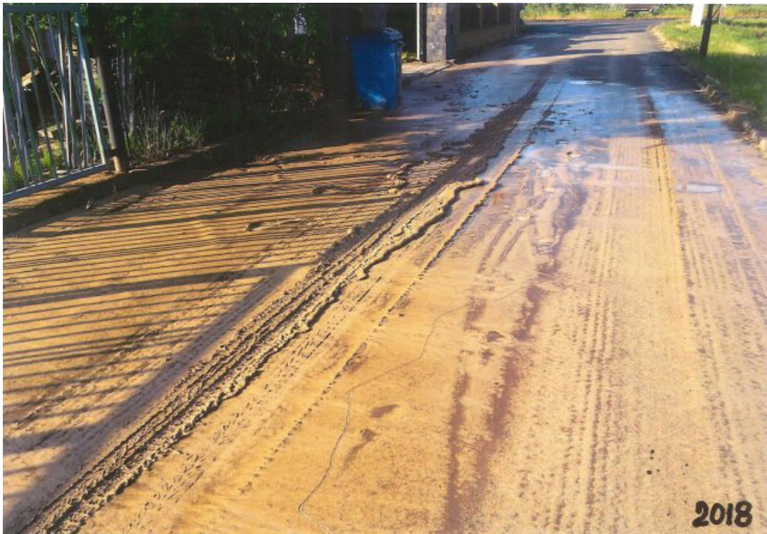
Obr. 42: Povodeň 5. června 2018 - ulice Polní