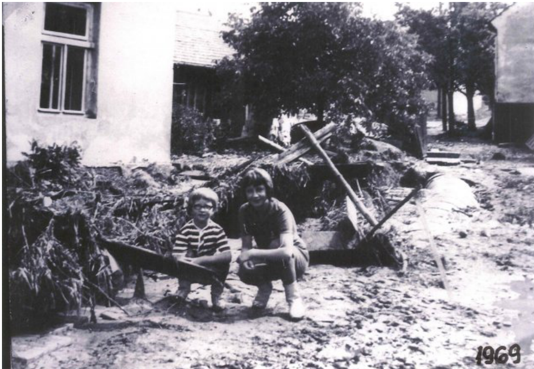
Obr. 34: Povodeň 6. července 1969