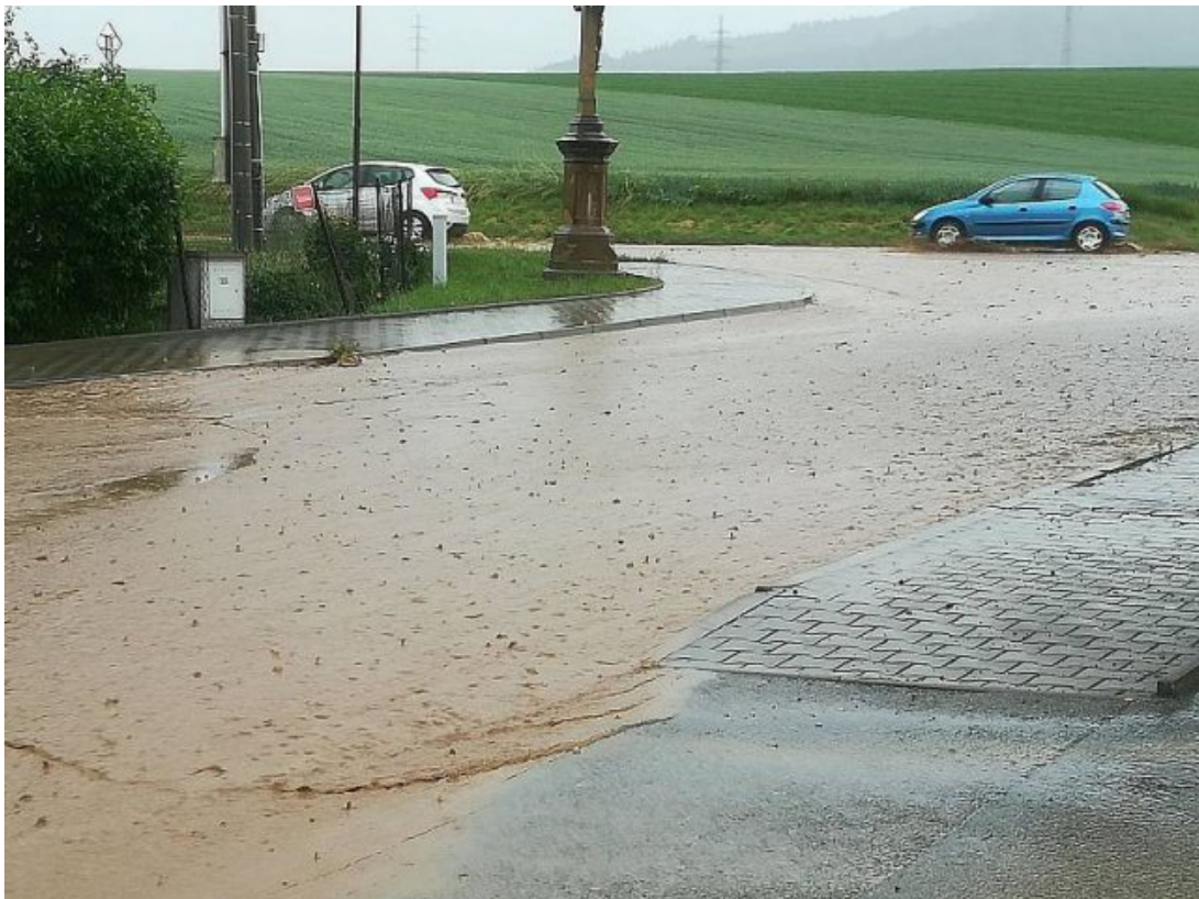
Obr. 39: Povodeň 5. června 2018 - ulice Trávníky (u Sokolovny)