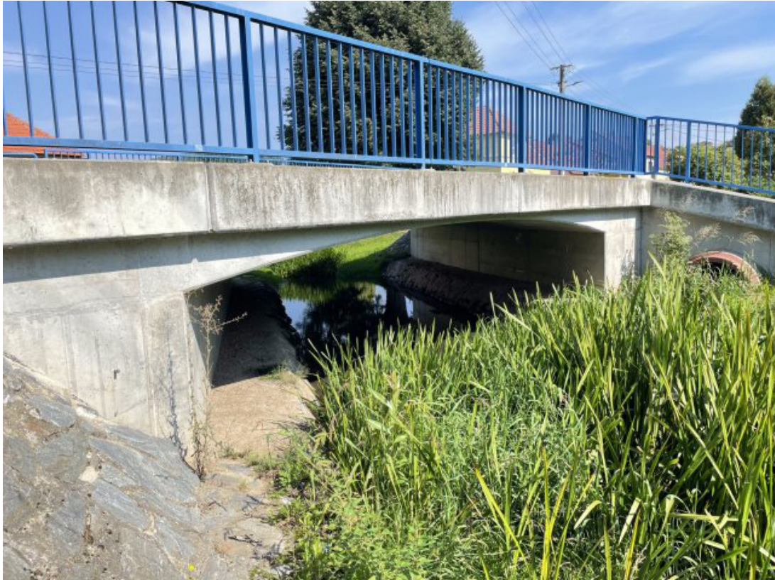
Obr. 19: Most ulice Chlumská (kapacitní, místo hlásného profilu) - jižní strana (Lysický potok, ř. km 0.65)