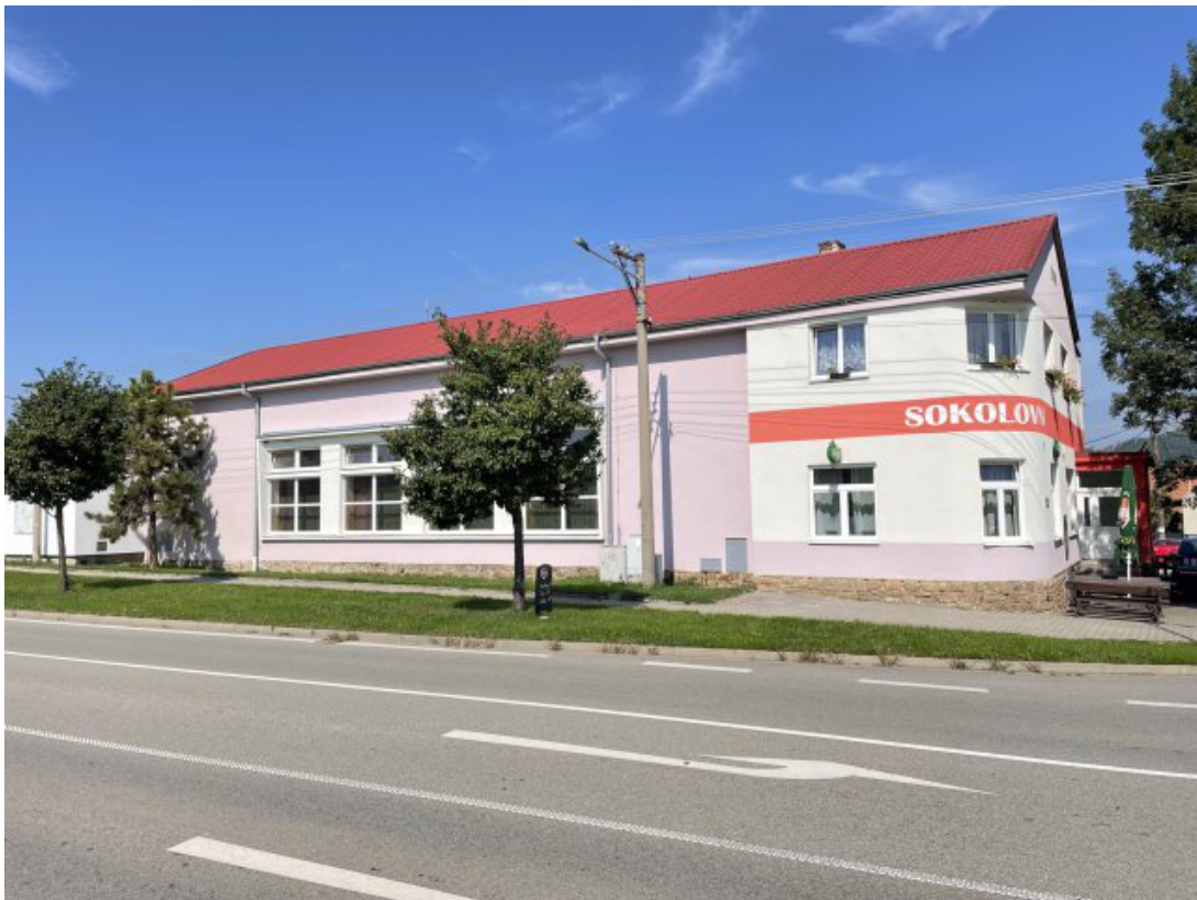
Obr. 4: Sokolovna Bořitov - evakuační místo