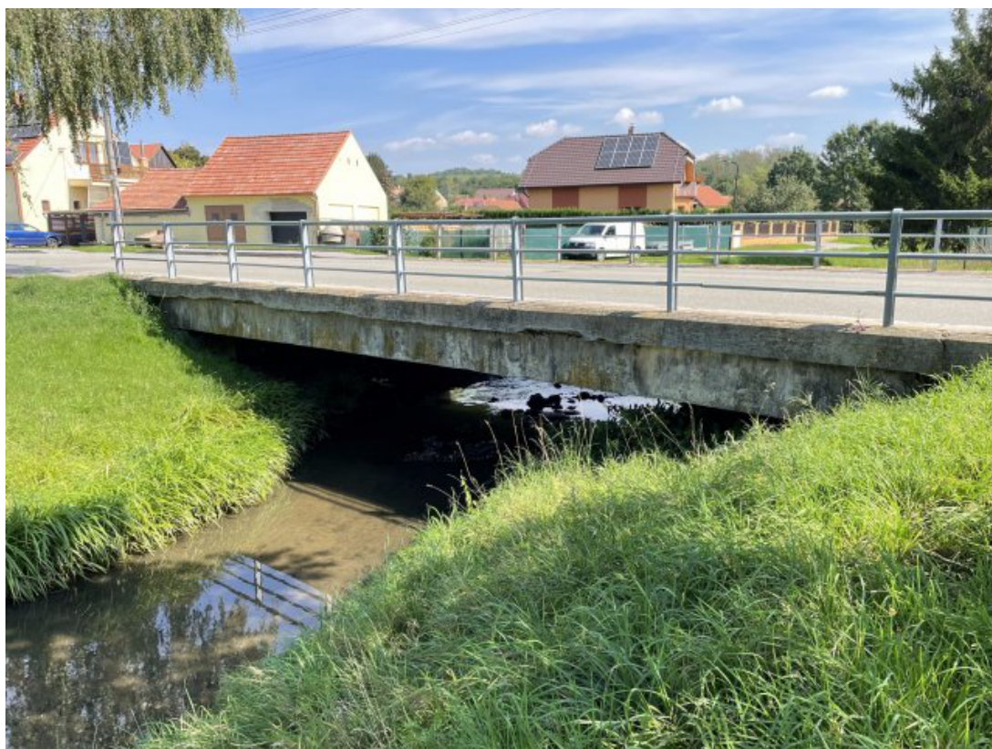
Obr. 7: Most ulice Sokolská (kapacitní, místo hlásného profilu) - západní strana (Býkovka, ř. km 3.8)