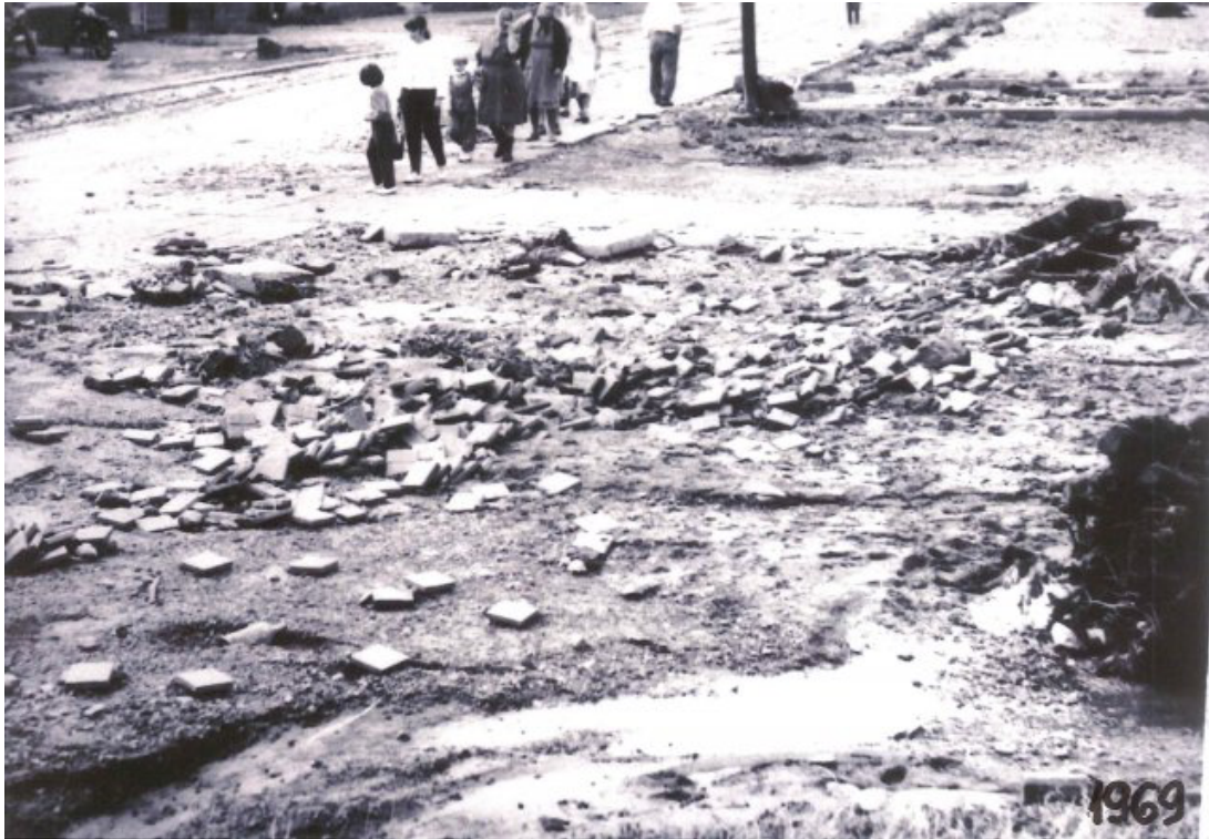
Obr. 36: Povodeň 6. července 1969