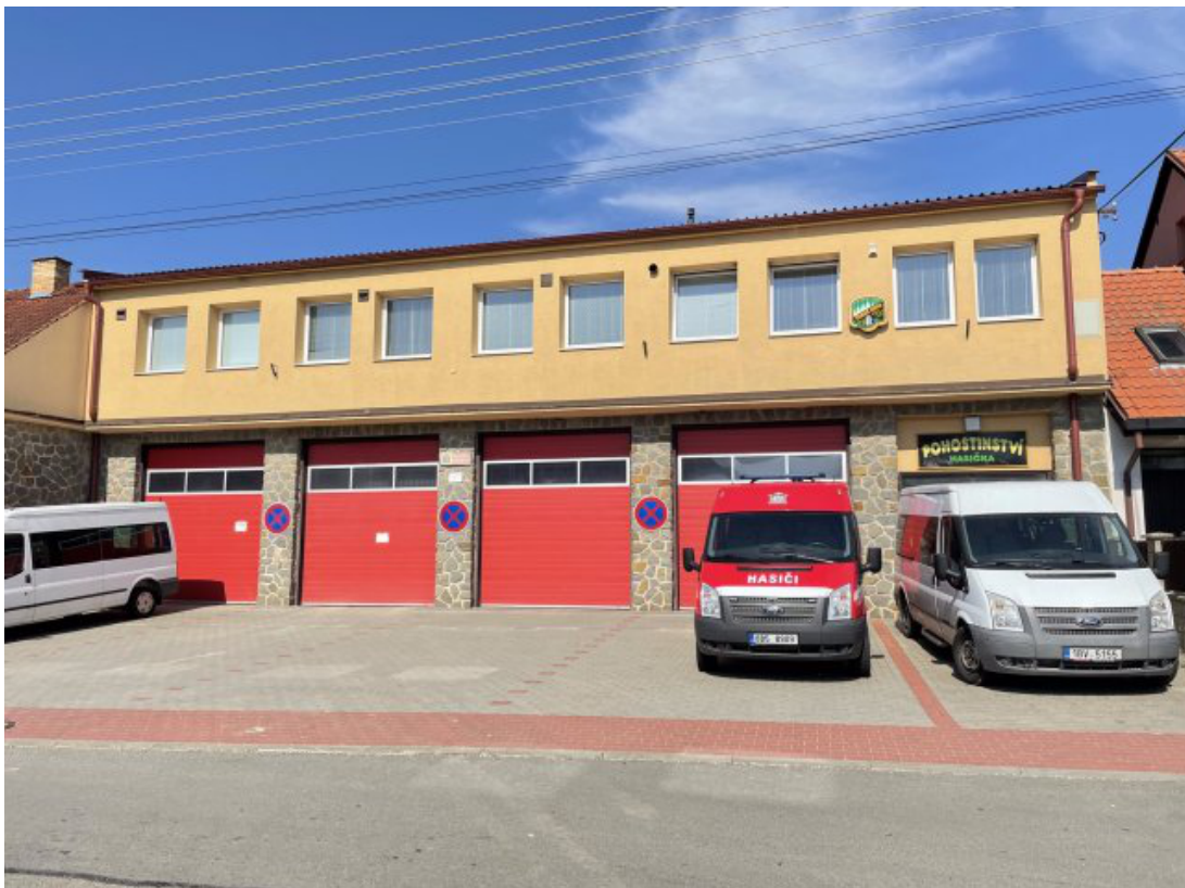
Obr. 2: Hasičská zbrojnice Bořitov - evakuační místo