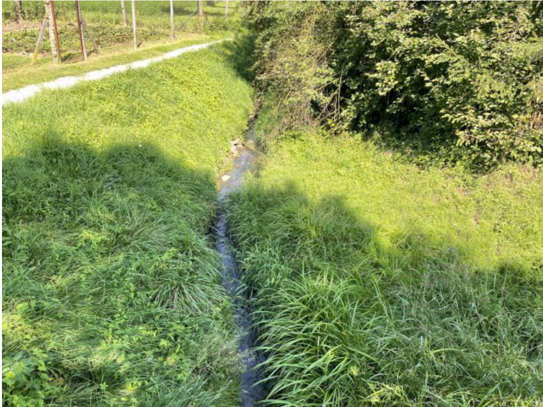
Obr. 10: Býkovka - charakter toku za mostem ulice Sokolská (po proudu, ř. km 3.75) - nekapacitní koryto