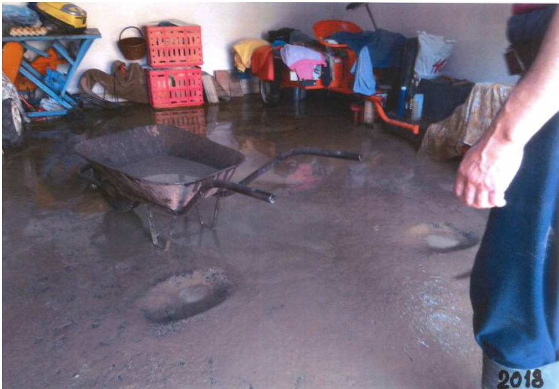
Obr. 45: Povodeň 5. června 2018 - ulice Polní