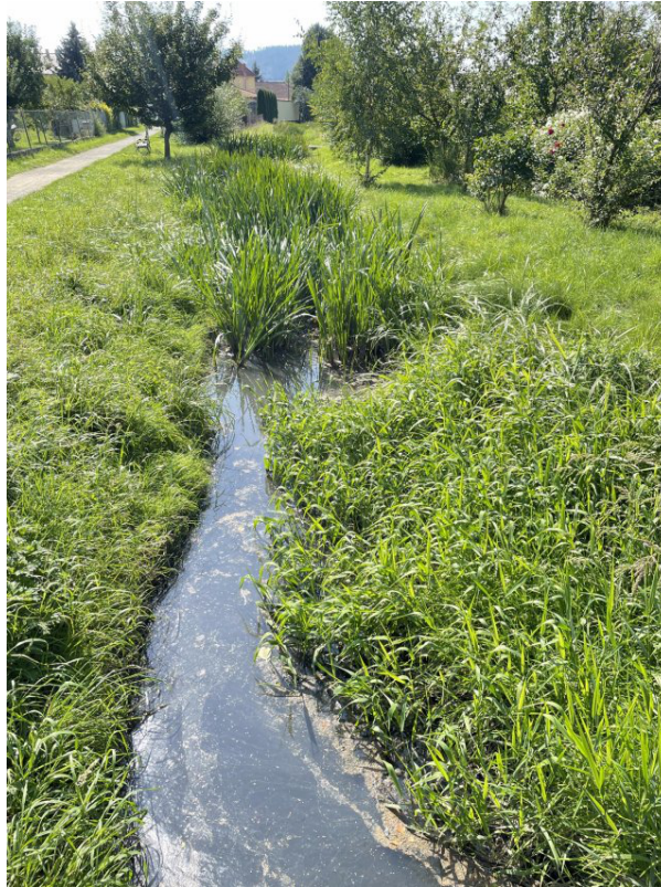
Obr. 16: Lysický potok - charakter toku z lávky (po proudu, ř. km 0.85)