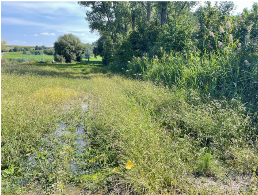
Obr. 27: Žerůtský potok - charakter toku po opuštění zatrubnění - voda zaplavuje pole (po proudu, ř. km 0.15)