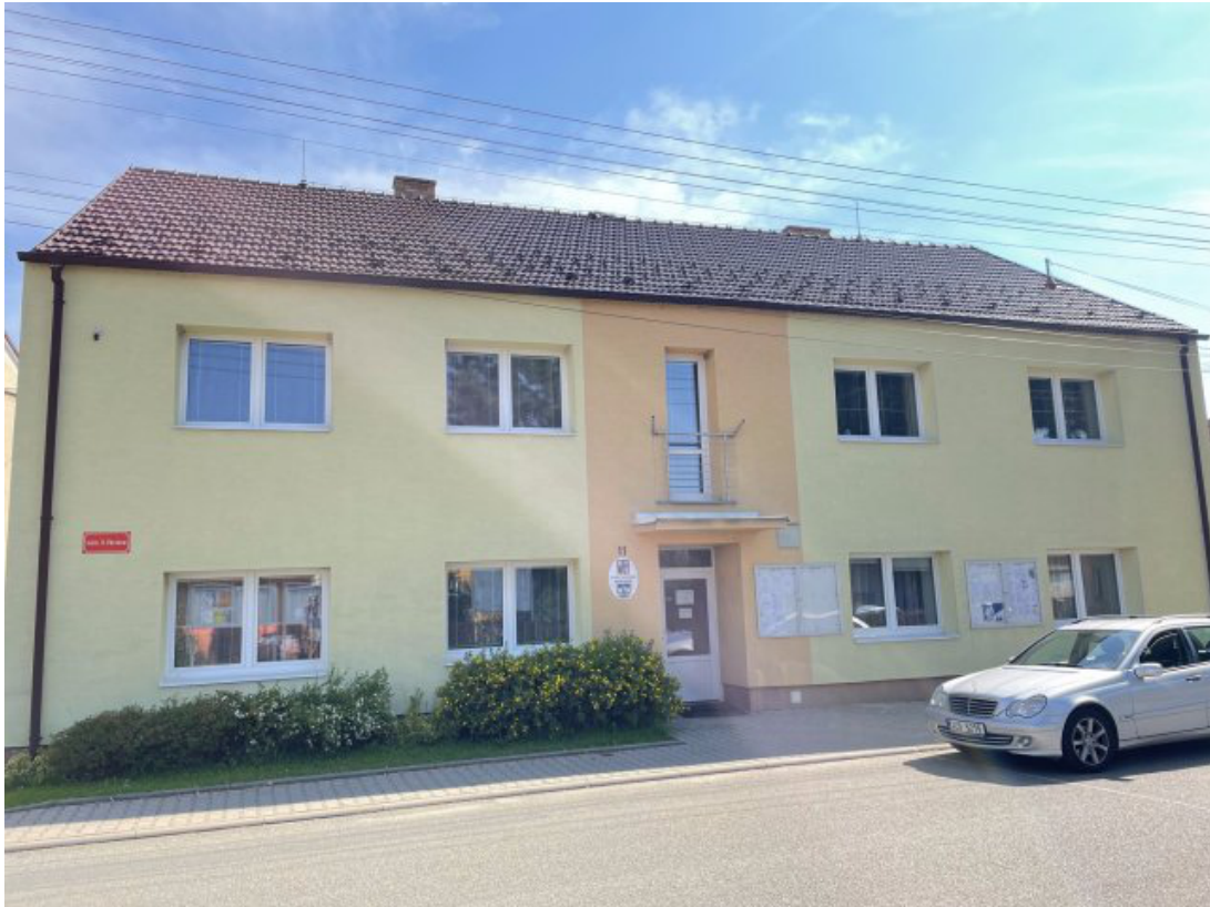
Obr. 1: Obecní úřad Bořitov - sídlo povodňové komise obce