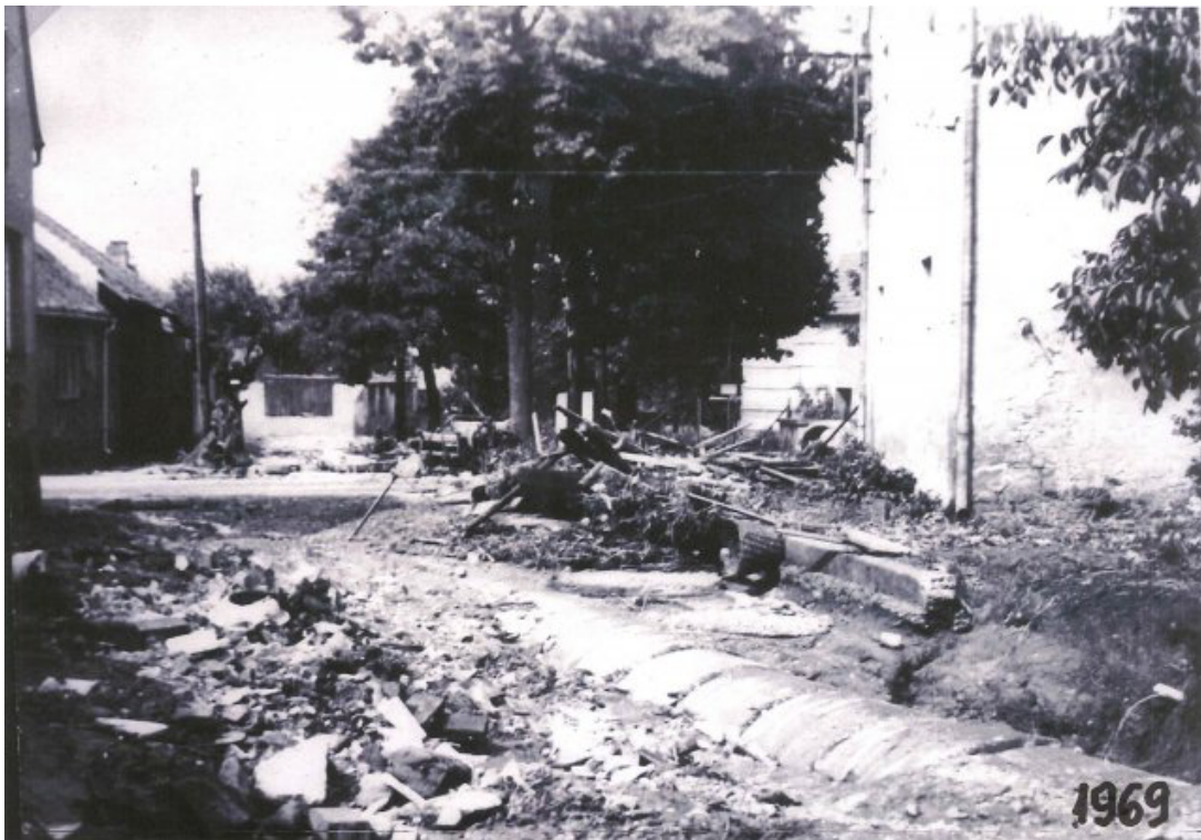
Obr. 35: Povodeň 6. července 1969