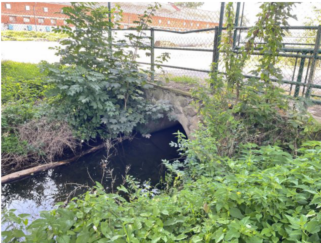
Obr. 28: Propustek pro Žerůtský potok - stagnující voda v propustku (po proudu, ř. km 0.05)