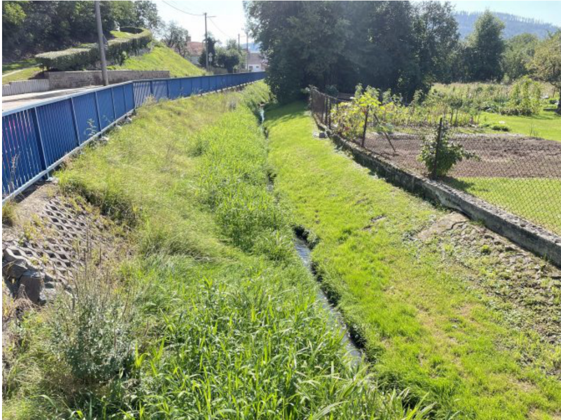
Obr. 23: Lysický potok - charakter toku z mostu ulice Rolínkova (po proudu, ř. km 0.3)