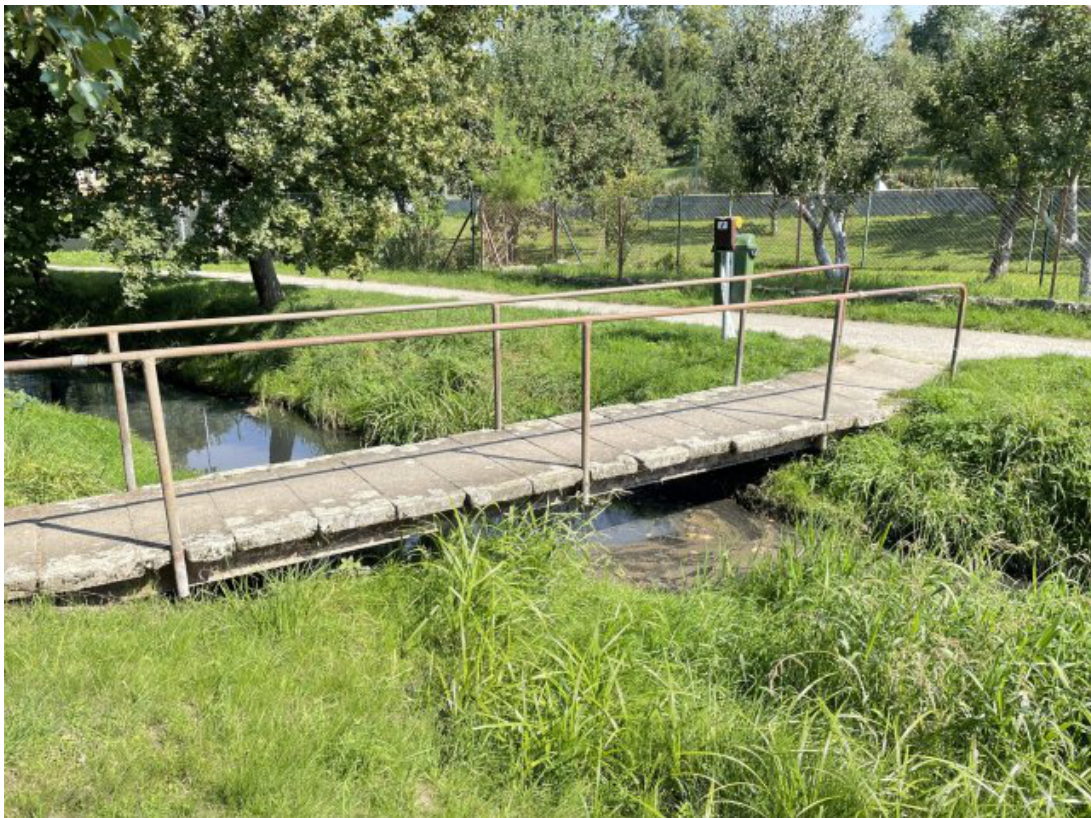
Obr. 15: Lávka přes Lysický potok (nekapacitní) - jižní strana (Lysický potok, ř. km 0.858)