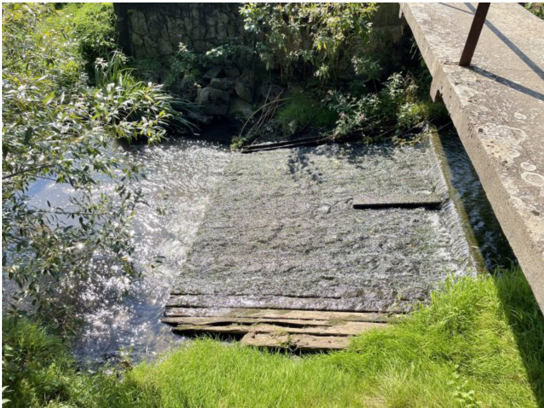
Obr. 13: Detail betonového skluzu (Býkovka, ř. km 3.6)