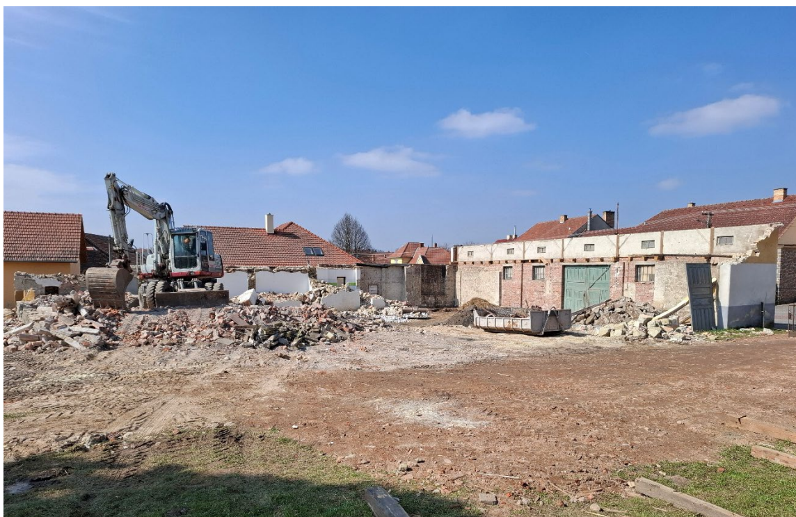
Pokračující práce na demolici stavení na ulici Chlumská č.p. 36.

Při potížích s kabelovou televizí volejte p. Jiřího Hoška, tel. 605 447 552.