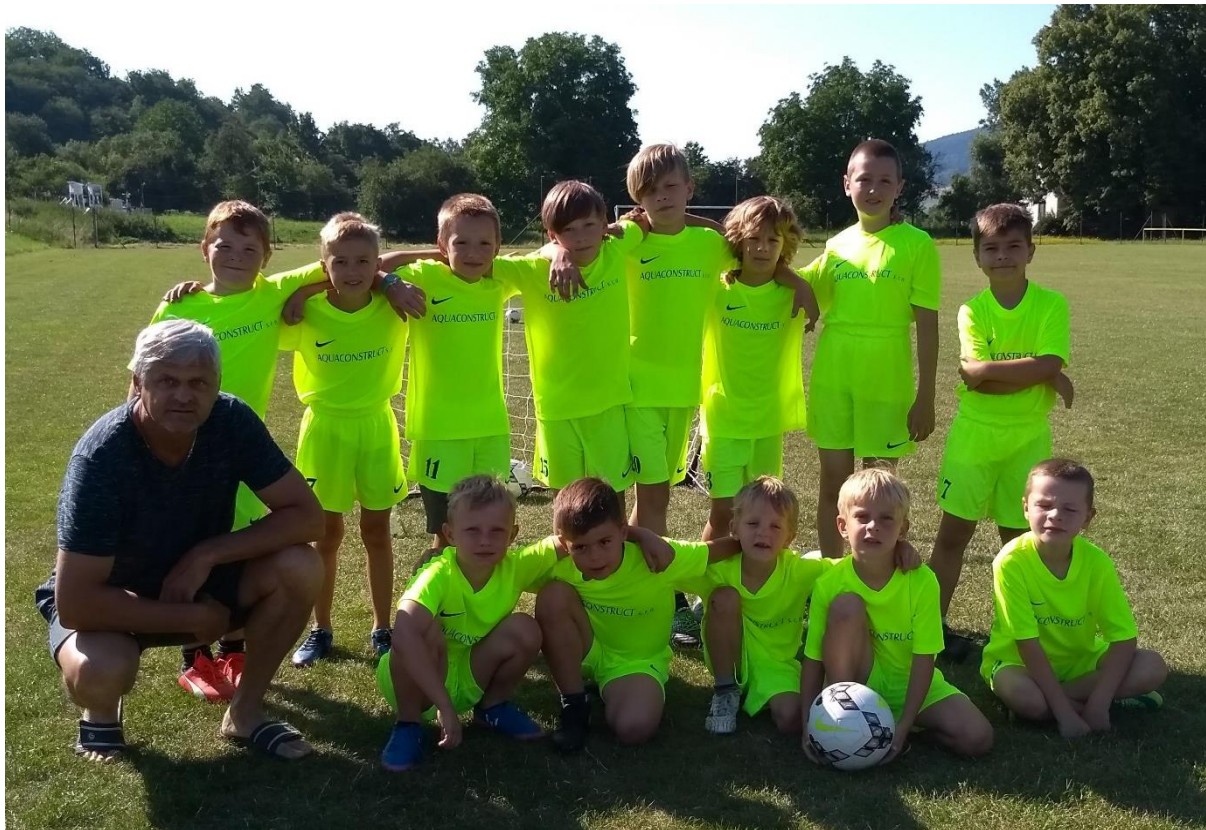
Archivní foto z prvního dětského tábora pořádaného v roce 2018 ještě ve starém areálu.

V termínu od 8.7. do 12.7.2024 pořádá fotbalový oddíl tradiční dětský tábor. Sejdeme se již po sedmé, prvních šest kempů bylo pobytových, letošní bude příměstský. K předem připraveným soutěžím a hrám se po celý týden budeme pod vedením zkušených trenérů scházet od 8:00 do 16:00 hod. Na závěr celého kempu si vše zhodnotíme a společně s rodiči si opečeme párek.